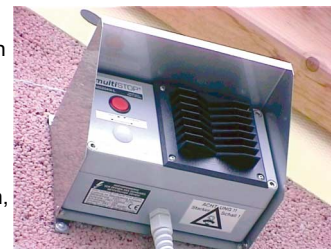
Abb. 6: Wandmontage mit Edelstahl-Haube (MS2040i-L-H)