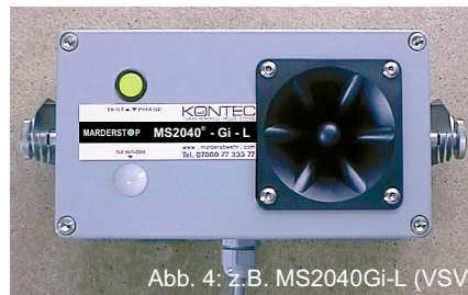
Abb. 4: z.B. MS2040Gi-L (VSV)