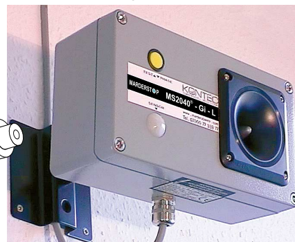
Abb. 3: z.B. MS2040Gi-L (KGH)